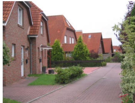
Ferienhaus Seck 2. Haus auf der linken Seite