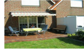
Haus bis 4 Personen & 1 Kinderbett

Gemütlich eingerichtete Doppelhaushälfte ca. 70 m 2 Wohnfläche mit Rollläden, Insektenschutzgitter überdachtem PKW-Parkplatz, Garten u. Sonnenterrasse mit Markise, Gartenmöbeln, Grill, Fahrräder & Kinderfahrradsitz, Abstellraum für Fahrräder. Sat-TV Flat und CD Stereoanlage Strandkorb am Textilstrand (Nr.350)