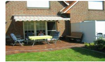
Haus bis 4 Personen & 1 Kinderbett

Gemütlich eingerichtete Doppelhaushälfte ca. 70 m 2 Wohnfläche mit Rollläden, Insektenschutzgitter überdachtem PKW-Parkplatz, Garten u. Sonnenterrasse mit Markise, Gartenmöbeln, Grill, Fahrräder & Kinderfahrradsitz, Abstellraum für Fahrräder. Sat-TV Flat und CD Stereoanlage Strandkorb am Textilstrand (Nr.350)