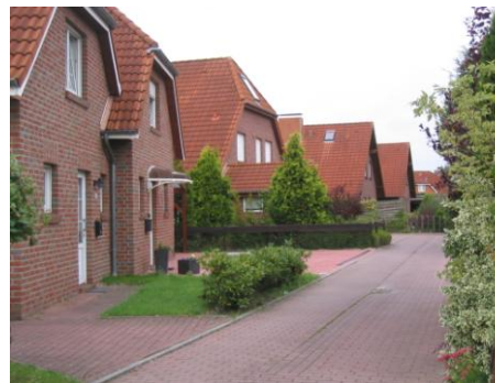
Ferienhaus Seck 2. Haus auf der linken Seite